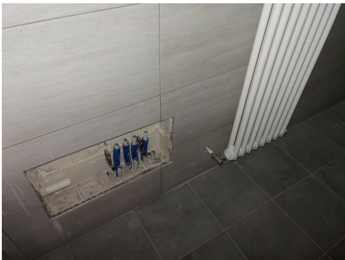
foto 11 - montare collettori e ripristinare collegamenti c.to sanitario